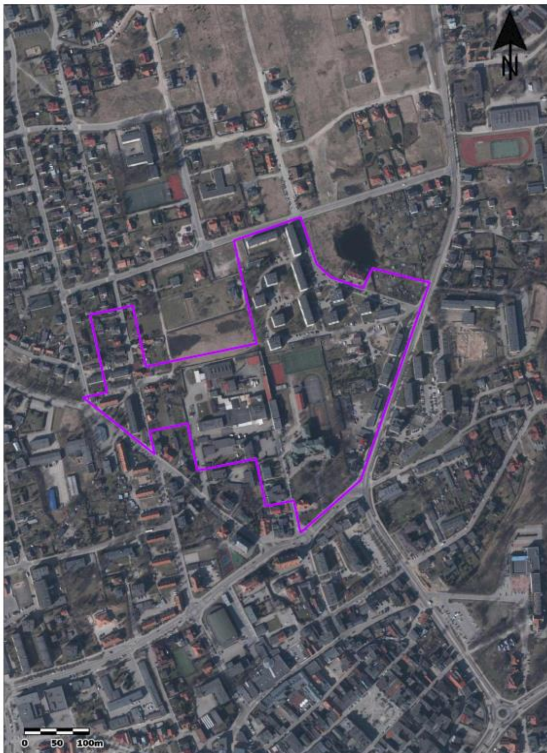
Ryc. 1. Lokalizacja obszaru rewitalizacji CZĘŚĆ I „Osiedle 1000-lecia”, w granicach którego mają być realizowane zadania, na tle najbliższego otoczenia ( www.geoportal.gov.pl ).