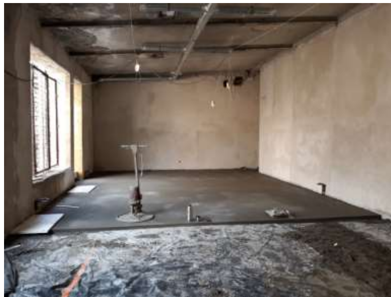
OBIEKT PO BYŁEJ KOTŁOWNI NA UL. KARTUSKIEJ