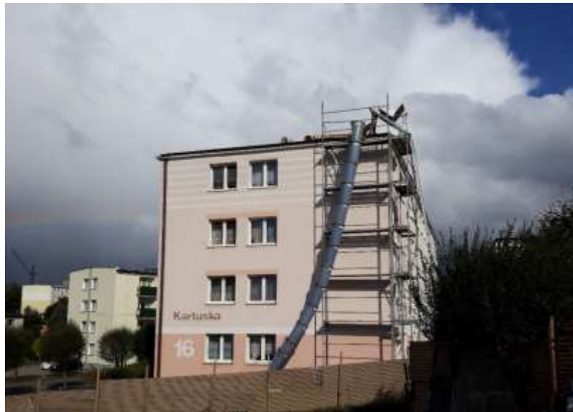
UL. KARTUSKA 16