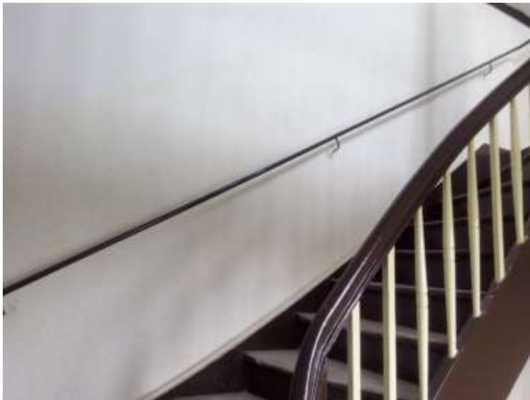
UL. LIPOWA 3