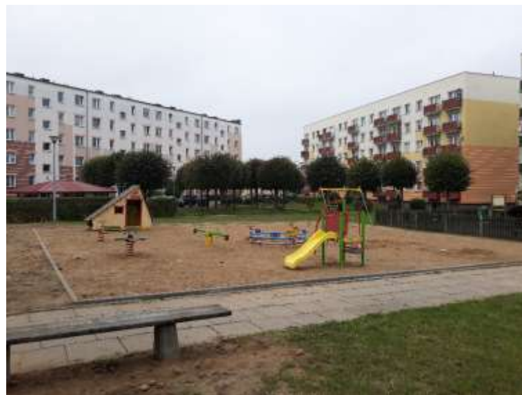
PLAC ZABAW UL. DĘBOWA