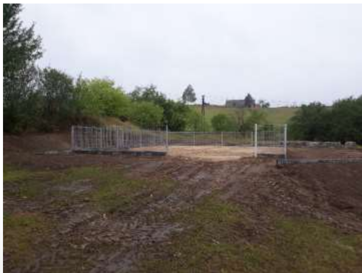
PLAC ZABAW NAD JEZIOREM GAŁĘŻNE