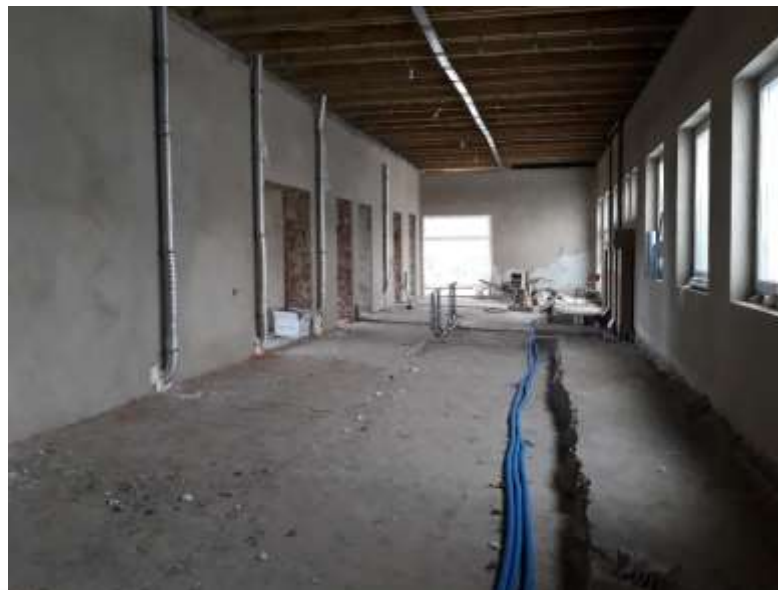
BUDYNEK USŁUGOWY PRZY UL. OSIEDLE 1000-LECIA 1