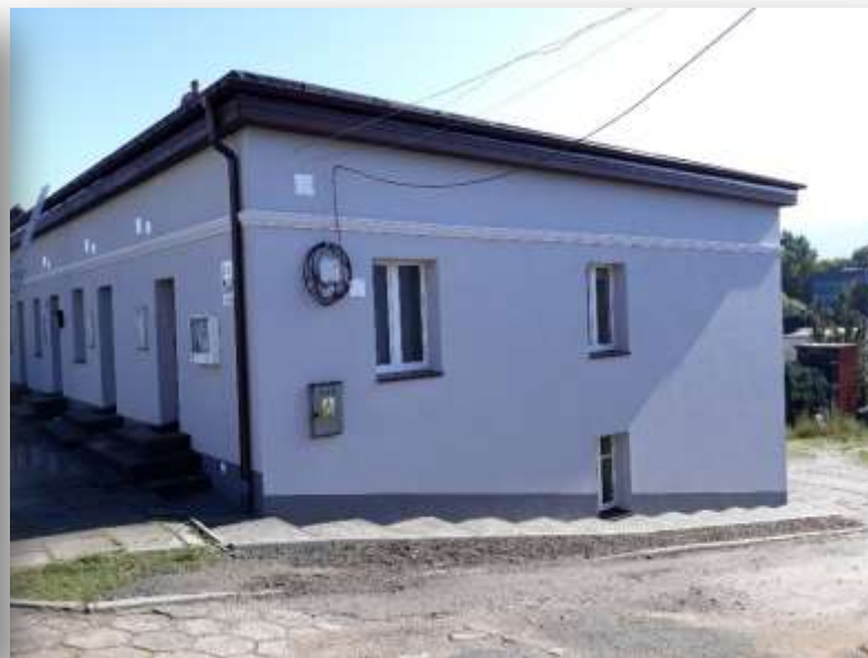
UL. WYBICKIEGO 14