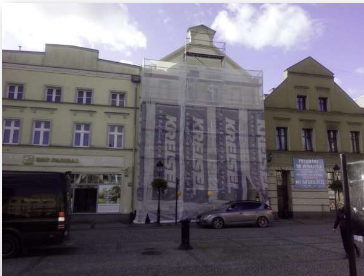
BUDYNEK BIBLIOTEKI MIEJSKIEJ