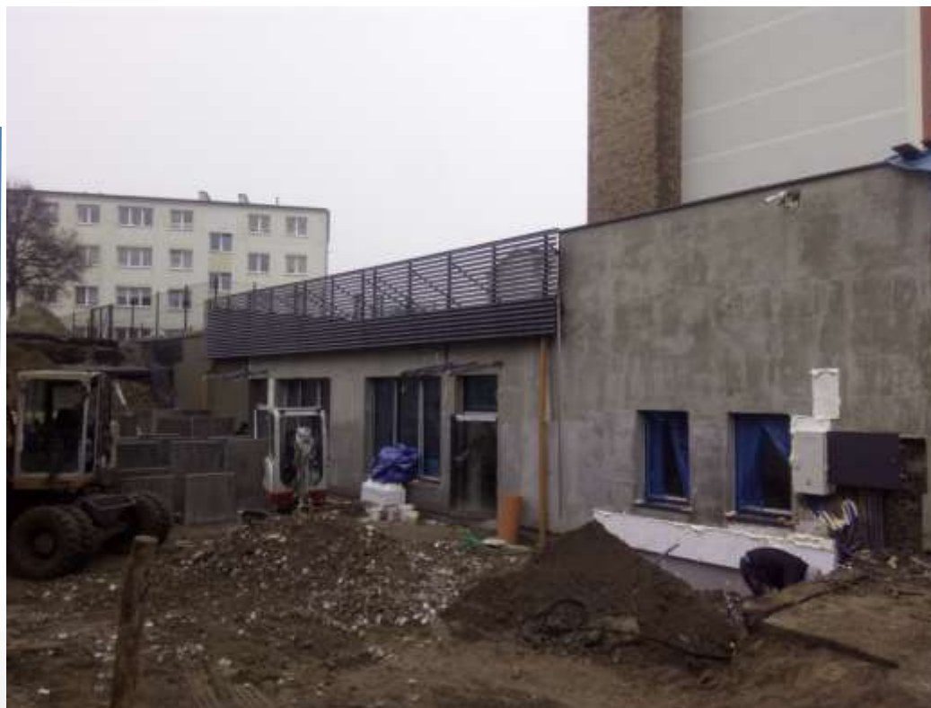
OBIEKT PO BYŁEJ KOTŁOWNI PRZY ULICY KARTUSKIEJ