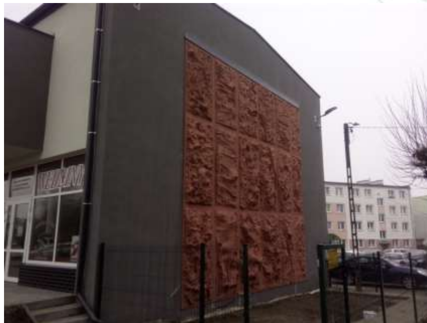
BUDYNEK USŁUGOWY PRZY UL. OSIEDLE 1000-LECIA 1