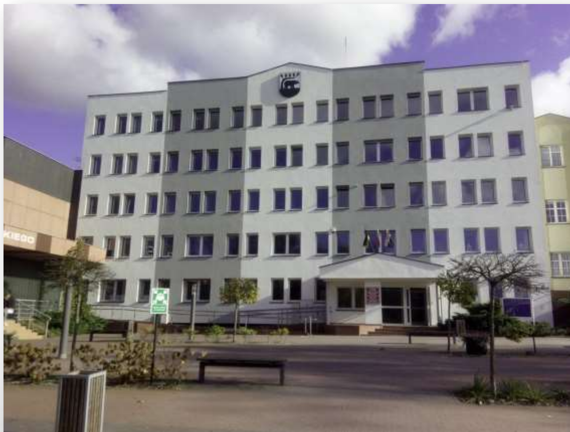
BUDYNEK URZĘDU MIASTA KOŚCIERZYNA